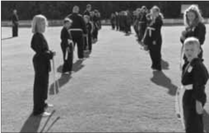
Das Bild zeigt die Gruppe an diesem Wochenende.