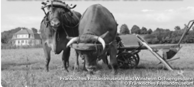
Fränkisches Freilandmuseum Bad Windsheim Ochsespann

In Frankens Mehrregion, dem Landkreis Neustadt a.d.Aisch-Bad Windsheim, kommt das gewisse „Mehr“ an regionalen Spezialitäten auf den Tisch. Die Vielfalt unserer Landschaft ist besonders ausschlaggebend für das abwechslungsreiche kulinarische Angebot. Eine Reihe von Restaurants zeichnen sich besonders durch ihre regionalen und saisonalen Gerichte aus. Die dazugehörige Videoreihe Genuss mit Leib und Seele verschafft dir einen Überblick über die Vielfalt der fränkischen Küche, die bei uns nicht nur Bratwurst mit Kraut und Schäufele zu bieten hat. In Burgbernheim wird Streuobst gelebt und erlebbar gemacht. Ab Mai 2025 öffnet das neue Streuobstkompetenzzentrum Bernatura und bietet spannende Einblicke in die Verarbeitung und Erzeugung von Streuobst. TreffpunktDeutschland.de/frankens-mehrregion