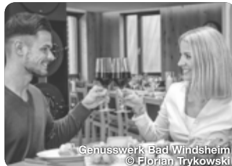
Genusswerk Bad Windsheim