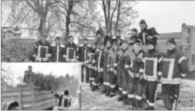
Gruppenbild Feuerwehr Christbaumsammlung