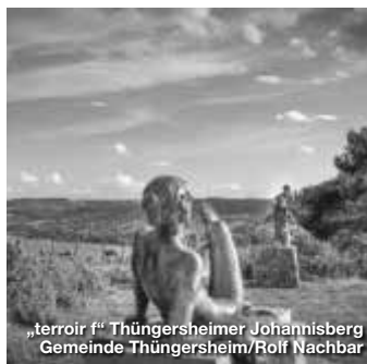
„terror f“ Thüngersheimer Johannesberg