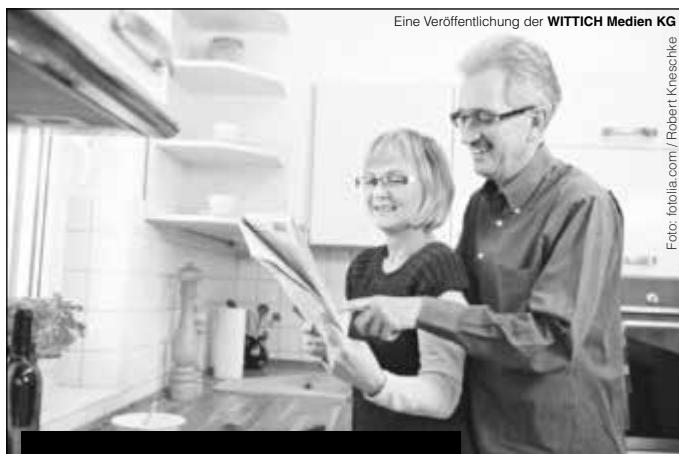
Eine Veröffentlichung der WITTICH Medien KG

WITTICH MEDIEN LINUS WITTICH Lokal informiert. Druck. Internet. Mobil.