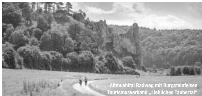
Altmuehltal Radweg mit Burgsteinfelsen

Entspannt radeln, die Naturvielfalt zwischen sonnigen Wacholderheiden, Felstürmen und lichten Wäldern auf verschiedenen Touren erleben und abends immer wieder in derselben gemütlichen Unterkunft ankommen – so ist es vielen Genussradlern am liebsten. Für sie hat der Naturpark Altmühltal, die abwechslungsreiche Radregion in der Mitte Bayerns, jetzt 15 neue Rundtouren konzipiert, die in der druckfrisch erhältlichen Karte „Radtouren – Tourenvielfalt und Altmühltal-Radweg erfahren“ verzeichnet sind. treffpunktdeutschland.de/altmuehltal